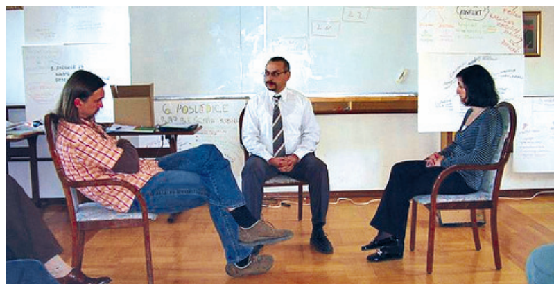
Usposabljanje za mediatorje pri Zavodu Rakmo.