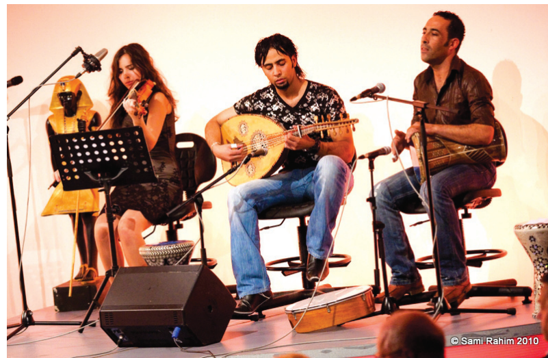
Arabski kulturni festival ŠAMS