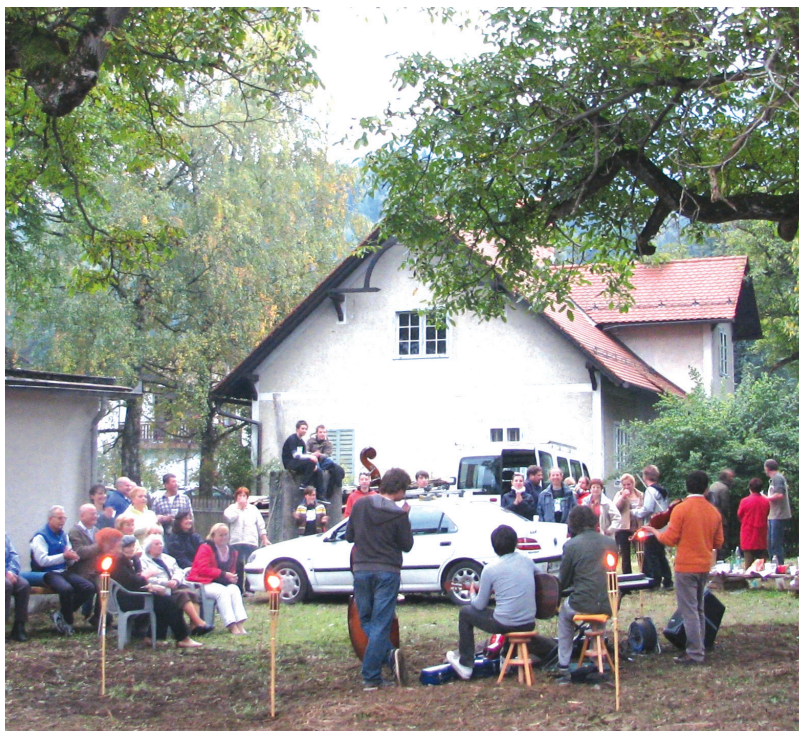
Po delovni akciji na Glazerjevi domačiji je bil izveden kulturni program.