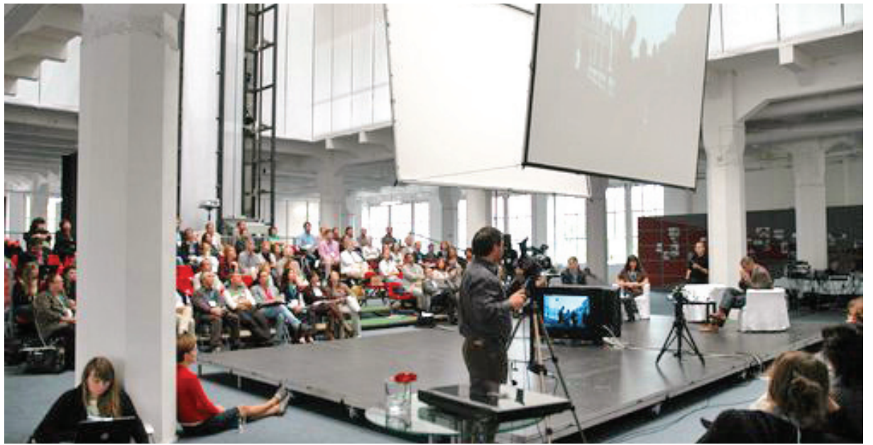
Plenumsko zasedanje Foruma CEE Trusta

Mislimo, da tovrstno branje družbenega in političnega terena postavlja pred aktivne samoorganizirane državljane – naj bodo formalno organizirani ali ne – nekaj jasnih izzivov. Iz ducatov mnenj,